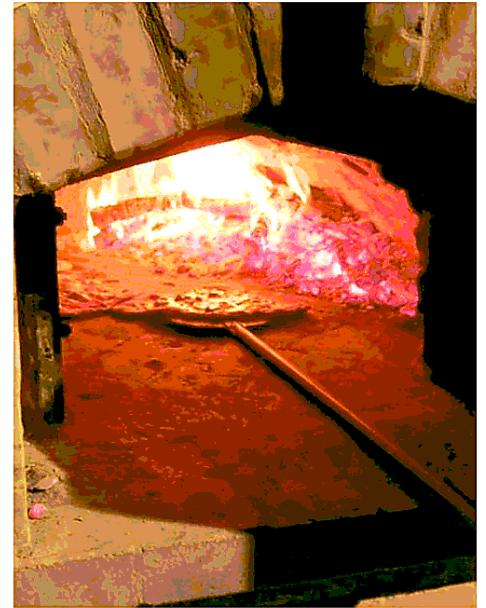
Tra i grandi produttori di polveri sottili i forni a legna delle pizzerie

Fa riflettere che l'incidenza dei motori diesel sulla produzione totale di Pm10 sia del 22 per cento a Milano e del 14 in tutta la regione. Quasi lo stesso valore degli effetti dell'usura di freni, pneumatici e strade, pari al 13 per cento in Lombardia, percentuale che sale al 21 per cento in città. Conta anche lo stile di guida. Quella sportiva, ovviamente, inquina di più.